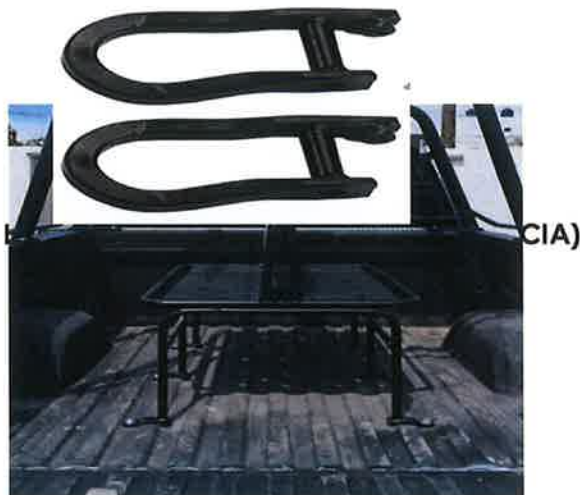
GANCHOS DE ARRASTRE ORIGINALES INSTALADOS EN CHASIS (IMAGEN DE REFERENCIA)