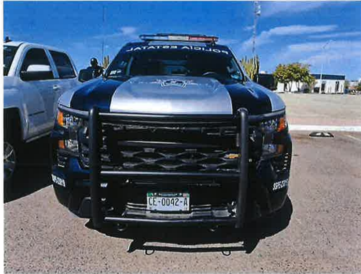
BURRERA (IMAGEN DE REFERENCIA).