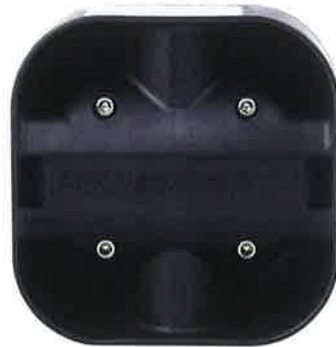
BOCINA DE SIRENA (IMAGEN ILUSTRATIVA DE REFERENCIA)

(NOTA HERRAJES DE MONTAJE DE TORRETA INSTALADOS CON TORNILLOS Y TUERCAS DE SEGURIDAD SUJETADOS EN LA BASE DEL TOLDO DEL VEHICULO, REFORZADO INTERNAMENTE CON SOLERA DE 1/8 DE ESPESOR, DE 10" A 12" PULGADAS DE LARGO x 1 ½ DE ANCHO)