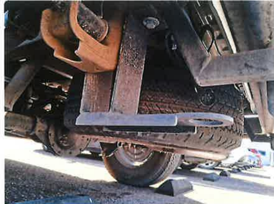
GANCHO DE ARRASTRE TRASERO ADICIONAL INSTALADO EN CHASIS (IMAGEN DE REFERENCIA)