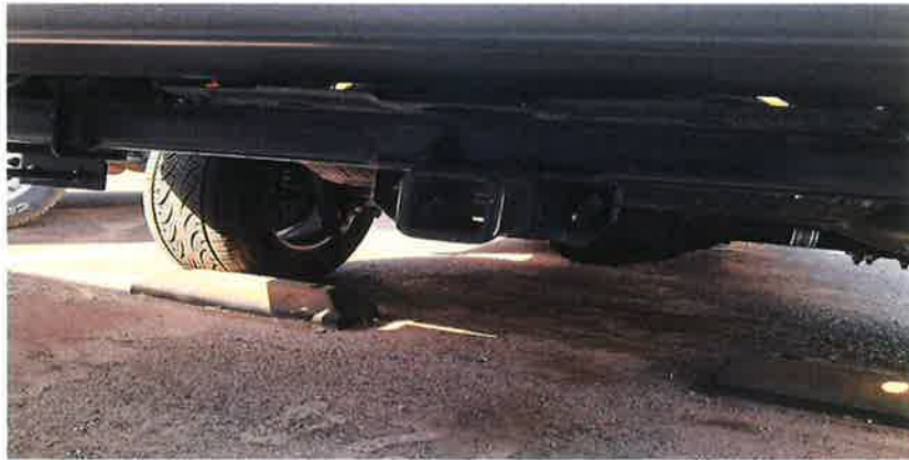
CUADRO PARA INSTALACION DE REMOLQUE DE ORIGEN SUJETADO A CHASIS (IMAGEN DE REFERENCIA)