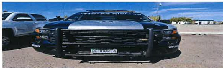
BARRERA (IMAGEN DE REFERENCIA)