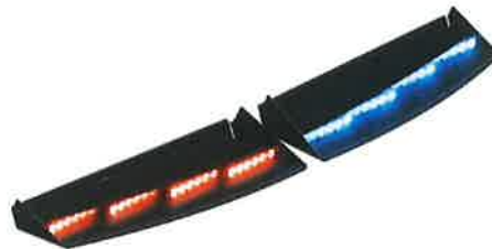
BARRA DE LUCES LED (IMAGEN ILUSTRATIVA)

216 LED ROJOS Y AZULES, DISTRIBUIDOS EN DOS SECCIONES DE CUATRO MODULOS DE 27 LEDS CON OPTICA DE DISPERSIÓN DE LUZ DE 60 GRADOS POR MODULO, MAS DE 20 PATRONES DE DESTELLO PROGRAMABLE. DISPONIBLE EN NIVELES DE DESBLOQUEO SIMPLE, DUAL, TRI. CUADRUPLA, QUINTUPLO Y AMBAR CORRIENTE DE 10 AMPERES VOLTAJE DE ENTRADA :10-18 VOLTIOS CC DIMENSIONES: 1" H X 2.25" W X 37.46" L 5 AÑOS DE GARANTIA POR EL PROVEEDOR CARCASA DE ALUMINIO PROPORCIONA REFUERZO ESTRUCTURAL GARANTIA DE 5 AÑOS, CERTIFICADO S.A. J595, CT13, SAE J1113-11, IP67